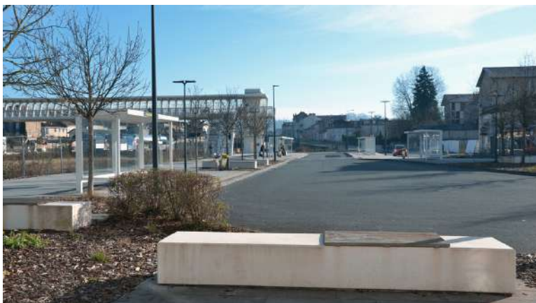
Pôle d'Échange Multimodal (PEM) et passerelle Simone Veil