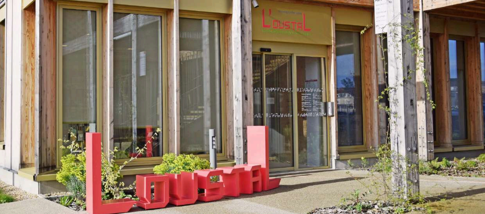
Entrée visiteurs du bâtiment Nord hébergeant Terren Périgord