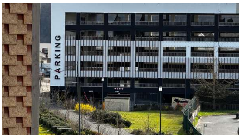
Vue depuis L'OustaL sur le parking