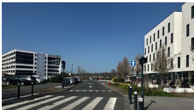
Entrée du quartier d'Affaires depuis l'Avenue du Maréchal Juin